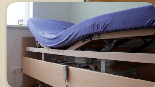
Bett im Bettsystem